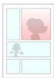
La case rouge ressort au milieu du bleu clair

La couleur joue également un rôle important et peut donner un ton particulier. Dans une case, elle rehausse l'action grâce à sa teinte. Cela est d'autant plus marquant si la case est d'une couleur différente au reste de la planche. Au contraire, une page monochrome peut créer un sentiment de cohérence visuelle ou de surabondance écrasante.