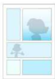
Une page monochrome bleue crée une impression de calme