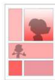
Une page monochrome rouge crée une impression de violence

La mise en page se construit en synergie avec l'histoire et participe à la narration. Voyons donc comment mettre en page votre histoire.